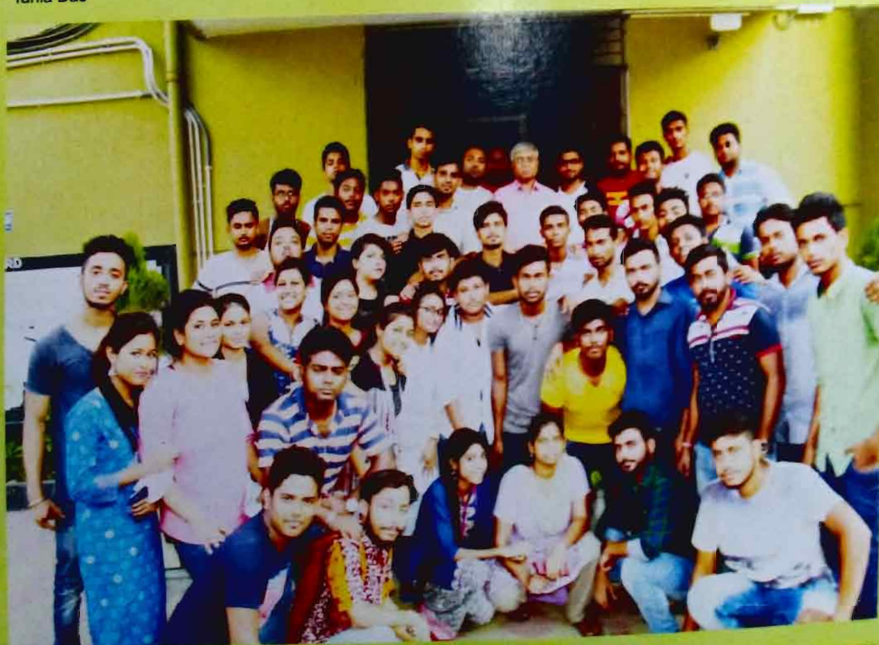
Members of Students' Union